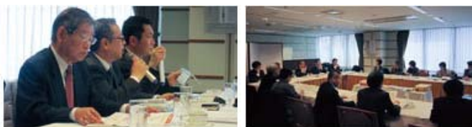
UCDAアワード2011評議会の様子

「UCDAアワード2012」は、企業が発信する情報を、産業・学術・生活者の知見により開発した尺度を使用して、「第三者」が客観的に評価・表彰するものです。UCDAは評価結果が改善のための指標となり、デザイン技術の発展とコミュニケーション品質の向上を通じて、企業と生活者双方の利益に貢献することを目指します。